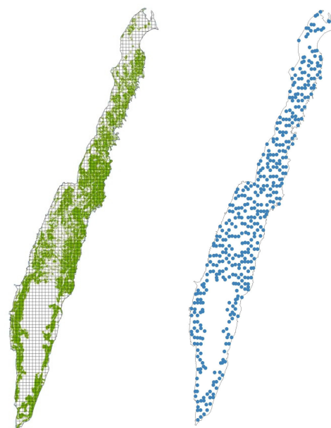
Figur 1. Figuren till vänster visar Öland med rutindelning och utbredning av lämplig naturtyp (markerat med grönt). Den högra figuren visar fördelningen av provpunkterna.

Svensk Naturförvaltning AB Rullagergatan 9 SE-415 26 Göteborg Tel. 031-22 30 45 info@naturforvaltning.se www.naturforvaltning.se